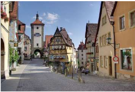
中世の街並みが残るローテンブルク

ベンツや BMW、ビールとソーセージの国、Jリーグがモデルとしたブンデスリーガで知られるサッカー王国ドイツ。経済や産業、スポーツばかりではなく、政治的にもドイツはEUのリーダーであり、環境政策では世界のオピニオンリーダーです。文化では現代デザインの源流であるバウハウス、ベルリンフィル、オペラやテクノなど美術や音楽でも世界をリードしています。政治、経済、文化のすべての領域で大きな役割を担う国なのです。