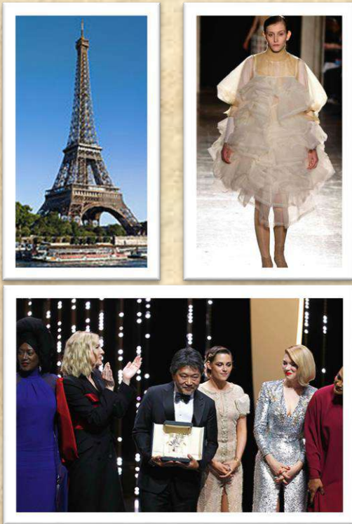
[写真]エッフェル塔(左上)、 パリコレクション(右上) カンヌ映画祭(下)

パリ。世界中のアーティストを引きつけてやまないこの都市の名を知らない人はいないでしょう。ランボーやカミュが詩や小説を発表し、ピカソや岡本太郎が画風を確立し、近年ではカリブやアフリカ出身のアーティストが多様な文化活動を行っている都市です。シャネルやルイヴィトン、日本のコムデギャルソン(フランス語で「少年のように」の意)などが先端的モードを発信するパリコレクションも有名です。