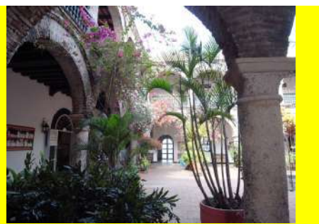
カルタヘーナ（コロンビア）

そして数々の出会いや心に残るような体験を生み出すための 一歩を踏み出してみませんか？