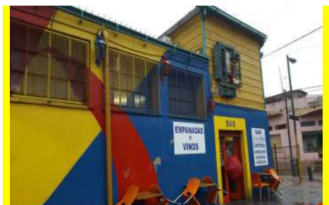
タンゴのふるさと、エル・カミニート （アルゼンチン）