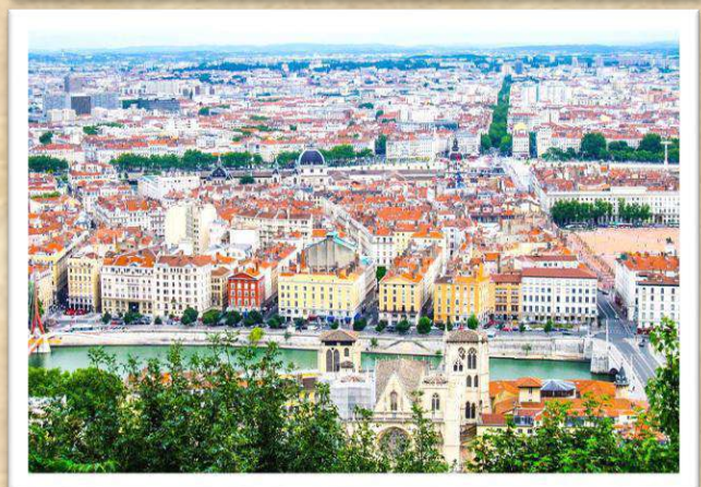
[写真] フランス語を学ぶニジェールの子供たち (上) フランス第二の都市リヨン (下)