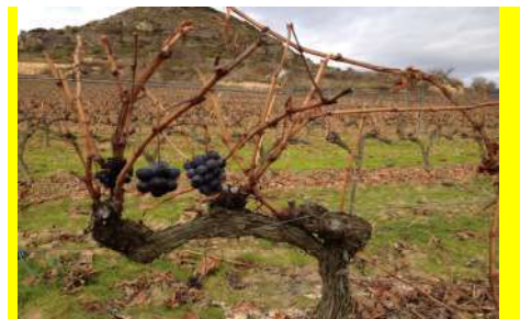
ワインの産地リオハ（スペイン）