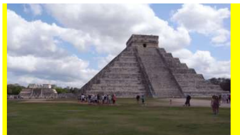
テオティワカン遺跡（メキシコ）