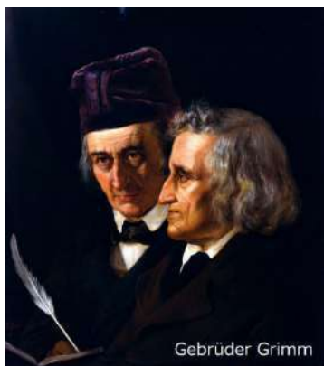
『白雪姫』や『ラプンツェル』等のメルヘンでも有名なグリム兄弟

ドイツ語はドイツ、オーストリア、スイス、リヒテンシュタインで使用されており、隣国オランダをはじめとするベネルクス三国はもちろん北欧や東欧などヨーロッパの多くの地域で広く話されています。ヨーロッパ旅行をしたい人、留学を希望する人、ドイツに関心がある人、ドイツ系企業に就職をねらう人にとって、ドイツ語は学びがいがある言葉です。