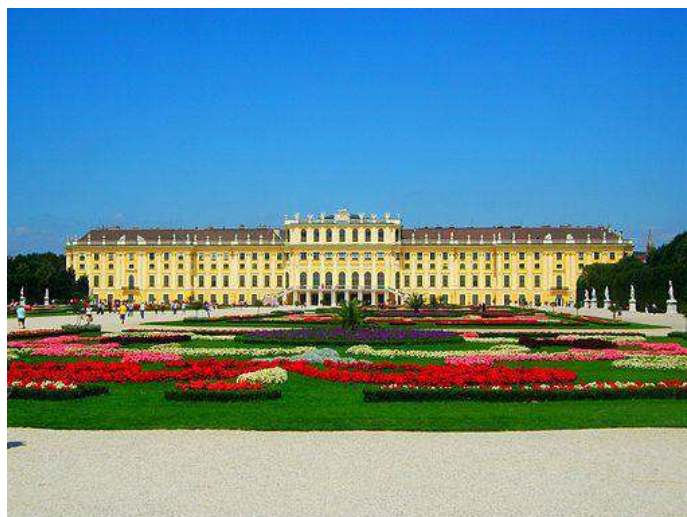
オーストリアの首都ウィーンにあるシェーンブルン宮殿 かつて絶大な権力を誇ったハプスブルク家の栄華が偲べれます

政治経済学部にはドイツ語圏に関わる多彩な科目が用意されており、スタッフも充実しています。皆さんがABCから始めて、やがて専門科目の政治学や経済学、社会学、地域論や文化論へとつながるようにカリキュラムができています。希望すれば大学院にもつながります。