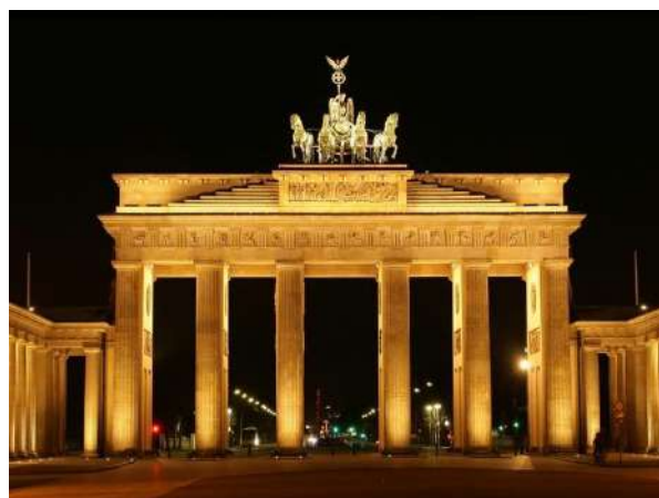
ドイツの首都ベルリンに立つ夜のブランデンブルク門 今日に至るまでドイツ史の光と影を見つめ続けてきました