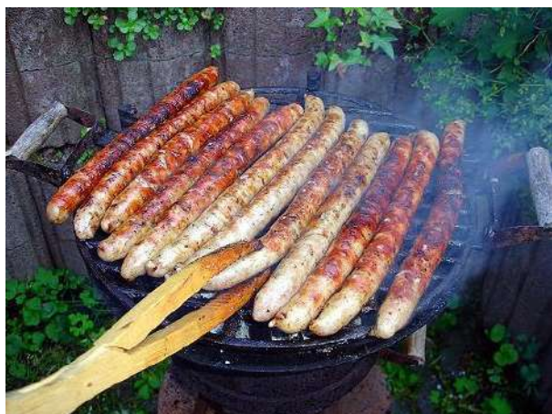
ドイツ・チューリンゲン州で食べられる名物ソーセージ 地域によって味も形も調理法も異なります

ドイツ語を習得して広い世界にはばたくことも夢ではありません。私たちスタッフは皆さんを心から歓迎し、皆さんに会える日を楽しみにしています。