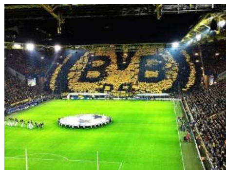
ボルシア・ドルトムントの本拠地は約8万人の観客を 収容するドイツ最大のサッカー専用スタジアムです