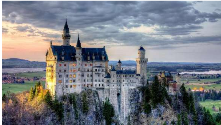
バイエルン国王ルートヴィヒ二世がたてたノイシュヴァンシュタイン城 ディズニーランドのシンデレラ城のモデルとされています

ベンツや BMW、ビールとソーセージの国、Jリーグがモデルとしたブンデスリーガで知られるサッカー王国ドイツ。経済や産業、スポーツばかりではなく、政治的にもドイツはEUのリーダーであり、環境政策では世界のオピニオンリーダーです。文化では現代デザインの源流であるバウハウス、ベルリンフィル、オペラやテクノなど美術や音楽でも世界をリードしています。政治、経済、文化のすべての領域で大きな役割を担う国なのです。