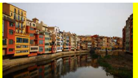
『ゲームオブスローンズ』の舞台となった ジローナ（スペイン）

検定試験について スペイン語技能検定（文科省後援）、DELE（スペイン教育文化スポーツ省によるスペイン語認定証）は学部で 受験料補助 を実施しております。しかも、級によっては卒業必要単位に 振替 が可能。