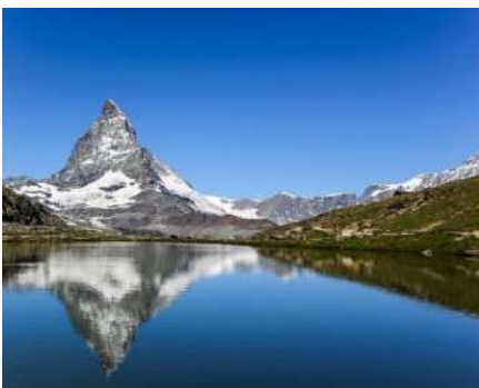
スイス・アルプスの名峰マッターホルン 湖面に映るその美しい姿は必見です

アルバイト Arbeit、カルテ Karte、メルヘン Märchen、ゲレンデ Gelände、バウムクーヘン Baumkuchen、アイスバーン Eisbahn、フェーン Föhn、ゼミナール Seminar、これらはみなドイツ語です。ドイツ語の発音はやさしくローマ字が読めれば2時間ほどでマスターできます。文法も例外が少なく誰でもすなおに理解できます。英語を学んできた皆さんにとっては、英語と親戚関係にあるドイツ語はとても学びやすい言語です。