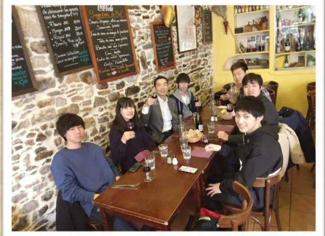
[写真] リヨン政治学院で学ぶ学生たち(上:1期生、下:8期生)