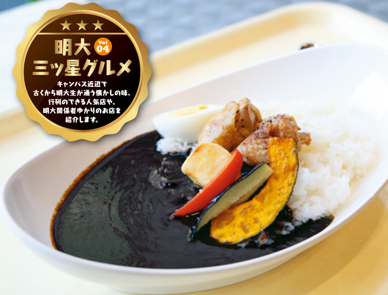
素揚げした野菜とチキン、ゆで卵と栄養バランスにもこだわった「黒カレー」(400円)