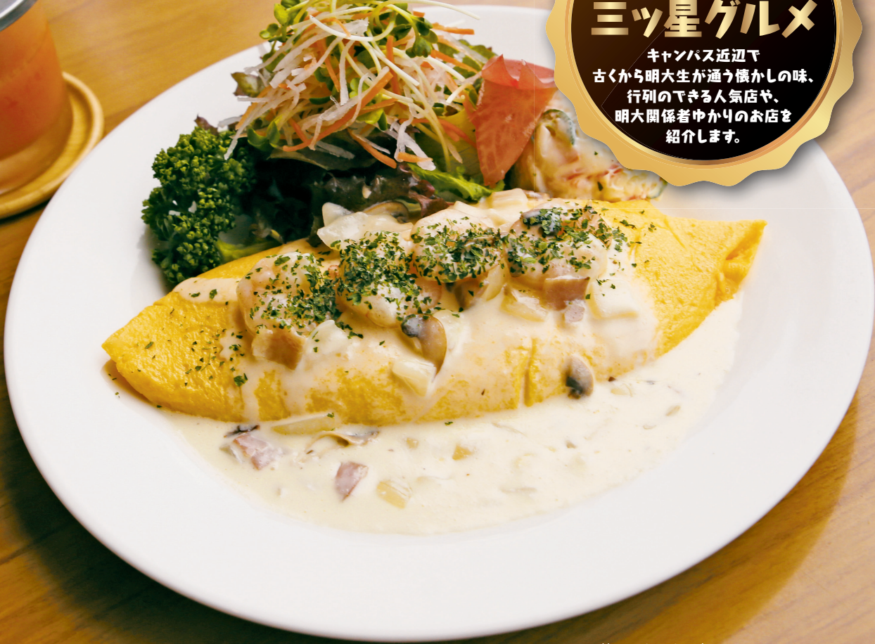
外はふわふわ、中はとろとろのオムレツ(1000円)。ドレッシングも絶品