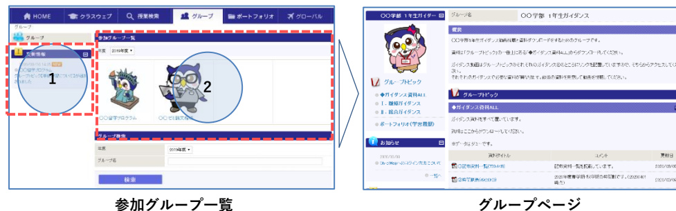
参加グループ一覧

「グループ」タブからアクセスし、正課授業以外のコミュニティ (例: ○○留学プログラム、○○ゼミ論文指導 etc.) の参加メンバーとなっている場合は参加グループが表示されます。本機能は「クラスウェブ」同様の機能を使用することが可能です。