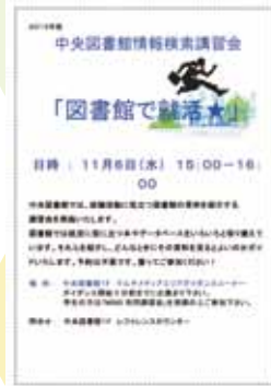
就活のサポートもばっちり!!

学生・院生のみならず、校友や山手線沿線私立大学図書館コンソーシアムの各大学の学生、リパティアカデミーの会員などの利用も多い図書館です。