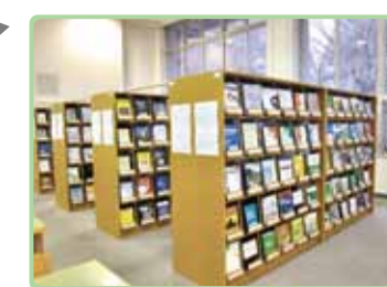
新着雑誌コーナー(2F) 国内外のさまざまな新刊雑誌を揃えています。バックナンバーは1F第4開架閲覧室とB1F書庫にあります。