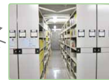
書庫(B2F)の電動書架 書庫資料についても開架資料と同様に手続きなしで利用できます。