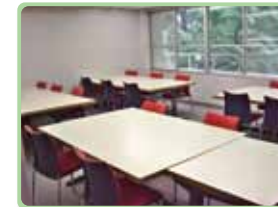
グループ閲覧室(3F) 話しながらグループで学習 できます。