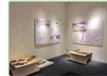
ギャラリー(2F)の展示風景 定期的に企画展示を行い貴重書等、特色ある図書館資料の紹介を行っています。

蔵書数 43万冊 +保存書庫 39万冊 蔵書数は「図書館年次報告書 2012」による