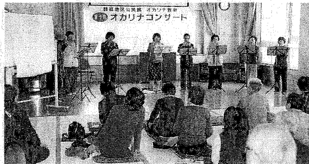
生徒と観客が一体となって楽しんだオカリナ コンサート

醇風地区公民館(鳥 取市西町五丁目)のオ カリナ教室の生徒たち が十六日、同公民館で コンサートを開き、集 まった約四十人の地域 住民の前に、素朴で優 しい音色を響かせた。