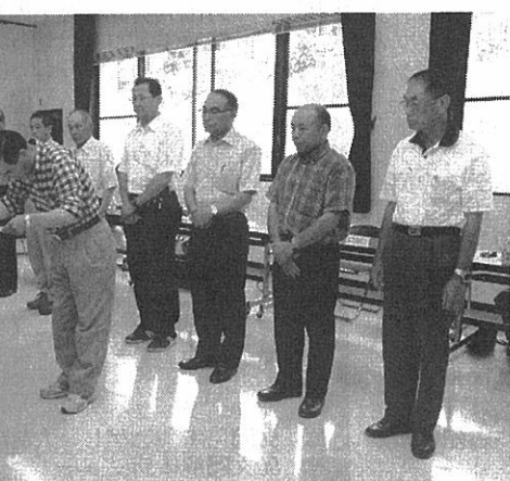
から感謝状を受け取る支部長

同署が表彰されたこと を受け、「安協の地道 な努力のおかげ」と授 与を決定した。