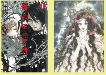
「薔薇王の葬列」菅野文(秋田書店、1巻、2014年) 「王妃マルゴ」萩尾望都(集英社、1巻、2013年) ほか