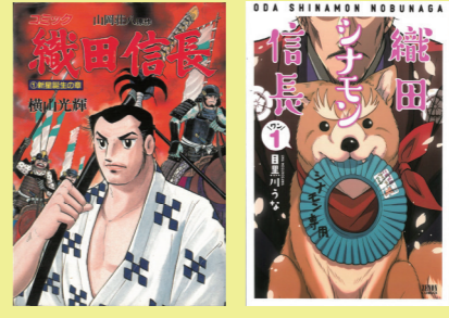
「織田信長」横山光輝、原作:山岡荘八(講談社、1巻、1985年) 「織田シナモン信長」目黒川うな(徳間書店、1巻、2016年) ほか