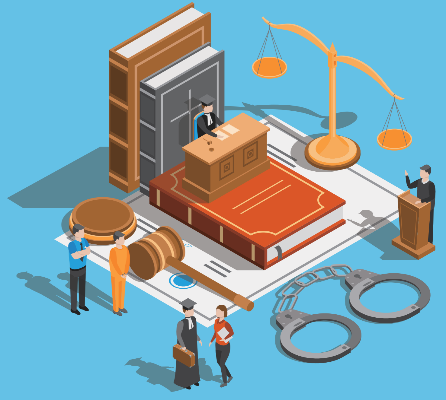
明治大学国家試験指導センター法制研究所