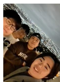
友達とのグリフィス天文台