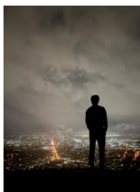
サンフランシスコの夜景