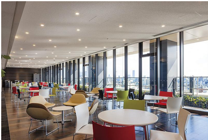
クロスフィールドラウンジ（高層棟6階）