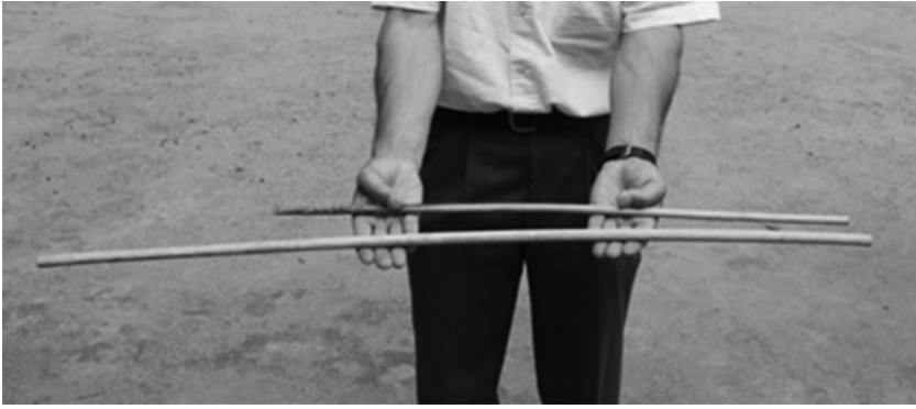
【写真2・放火用謀略兵器とおもわれるもの】

写真2は今回見つかった放火用謀略兵器と思われるものです。単なる長い筒状のものですが、筒状のこの中に穴が開いていて可燃性の物（着火剤）が入っています。火をつけるとボーッと20センチくらい火が噴き出ます。一見すると花火みたいですが、恐らく放火をする道具です。実はこれは中沢の工場から戦後、周辺にお住まいになった方が持って来たものです。そこで作っていた物を黙って持ち出したということだと思いますが、持って来て、この2本あるうち短い方の1本は火をつけてみたようです。火をつけたらボーッと火が出て、ちょうど蜂の巣を焼くのに都合が良くて何回かそれで蜂の巣を焼いたという証言があります。実際に焼いた人がお持ちだったので、それはまず確実だと思います。1本は全く使っていない、1本は何回か使って短くなったものです。これは完成するとどんな姿になるのかはよくわかりません。もともと傘に仕掛けた放火用の兵器というのがありますが、傘の柄の中に入れるようなものなのか、それともこれをぶつ切りにして、導火線のような役割をはたすような使い方をしたのか、はっきりとはわかりませんが、少なくともこれは伊那地方の中沢小学校、当時の国民学校を中心に登戸の工場ができるのですが、その近くの神社も工場になっていて、この兵器を作っていたそうです。今回私たちが調査に行った時に、この放火用謀略兵器をお持ちの方に会い、実際燃えた跡がはっきり残っていました。ちょっと危険な物ですから、火が点かないようにして展示しています。