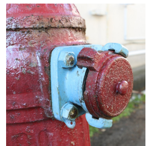
海軍消火栓放水口部拡大

サイズを比較すると、登戸研究所のものは高さ66cm・胴回り59cmに対し、同病院のものは高さ(台含まず)75cm・胴回り64.5cmと少し大きいことがわかりました。(塚本記)