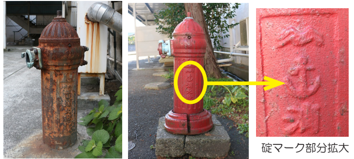
海軍が使用していた消火栓(左)横須賀市米が浜通(右)同市船越町

それでは、他の軍関連施設ではどのような消火栓を使用していたのでしょうか。海軍の消火栓が残る