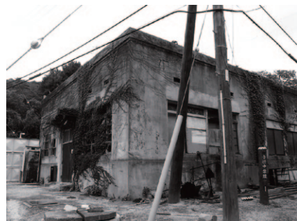
写真左上から時計回りに (1) 千代ヶ崎砲台第三砲座跡（神奈川・横須賀）、(2) 陸軍重砲兵学校薬莖庫と推定される建物（神奈川・横須賀）、(3) 検査工室（広島・大久野島）