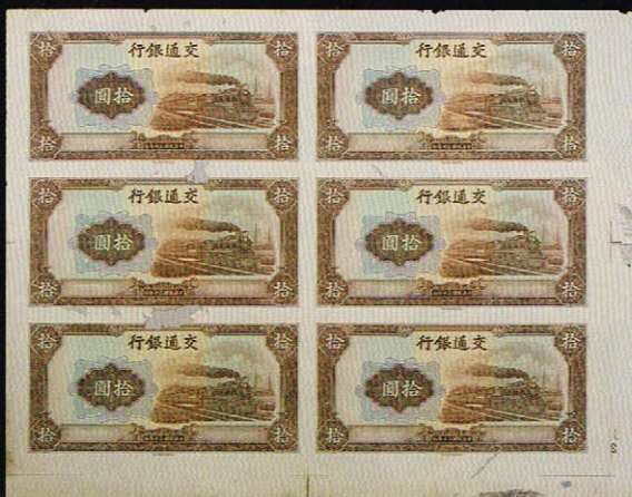
「交通銀行10元券六連偽札」(当館所蔵)