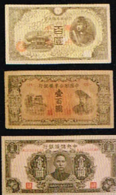
日本陸軍の経済謀略に使用された紙幣 上から軍用手票(軍票)、 中国連合準備銀行券、 中央儲備銀行券(すべて当館所蔵)