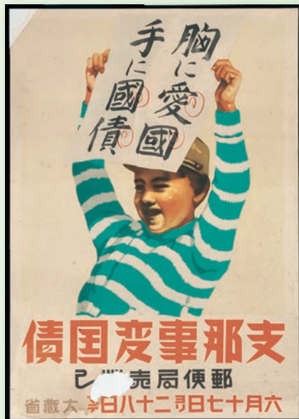
支那事变国債ポスター (1940年、複製、長野県阿智村所蔵)