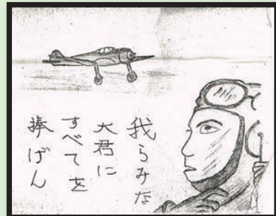
当時の学童疎開児の作品 (複製)