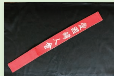
愛国婦人会たすき (明治大学平和教育登戸研究所資料館所蔵)