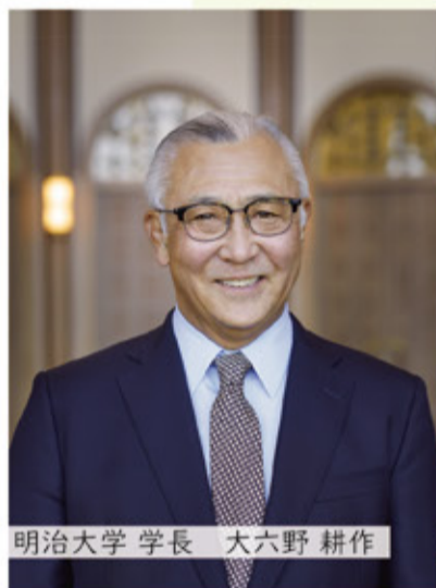
明治大学 学長 大六野 耕作

教育や国際化はもとより、異質性・違和感を 起点とする自己認知、あそび、ゆらぎ、 自己組織化など、硬軟交えたキーワードが 自在に行き交う「フリーセッション」を支える 進行役（兼鼎談者）は、物理学者として著名な 西森拓・MIMS副所長です。