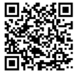
↑ QR コード ↑