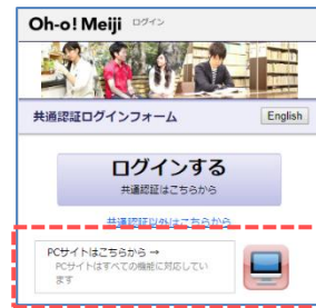
↑ スマホサイト ↑