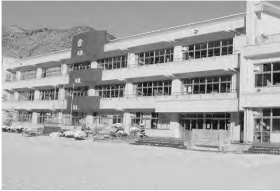
3月10日の朝日を浴びる雄勝中学校