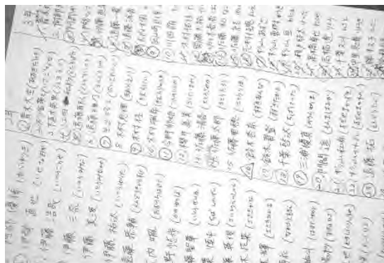
手書きの名簿で安否確認

とにかく、子どもたちの安否確認をしなければいけません。77 名の名簿も何も一切なくなってしまったわけです。手元には何もない中に紙が 1 枚あったので、それに中学 3 年生の担任だった先生と養護教諭の 2 人の先生が、名簿順に漢字でしっかりと全員分の名簿を書き上げて作りました。この名簿に、一つ一つ探しては、生存を確認して丸を付けていくわけです。これは、そのときの原本です。とにかく、この丸一つが単なる丸ではない、命の丸なのです。とにかくこの丸を求めて、そこから本当に毎日悪戦苦闘の日々が続いていきます。