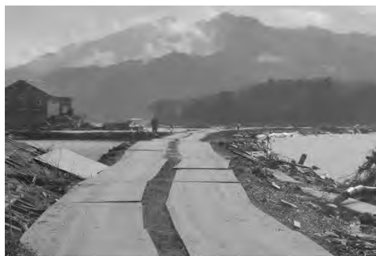
大川地区は水没したまま

ところが、雄勝に入っていくと、浜浜はこのような状況です。もう何もないのです。このような状況下でも、子どもたちがどこかの避難場所に「いる」と聞けば、そこに行って元気であると飛び上がってお互いに喜び合うような日々が続くわけです。そして、帰りは必ず大川小学校の前を通ります。