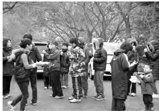
山の中へ避難 おにぎりをもらう 長く寒い夜が続く

寒い夜を越すために、気を紛らわすために、この紙飛行機を作ってあげたのでしょうか。実はこの2人のお姉ちゃんは、前日卒業式に参加した3年生でした。お母さんはその式に参列したあと、お父さんに「今日は卒業式だから仕事に行かなくていいのでは」と言われながらも、職場が心配だということで、雄勝病院に行きます。そこで地震に見舞われるわけです。患者たちを1階から2階、2階から3階、屋上まで上げて、そしてそこで津波に飲まれてしまいます。