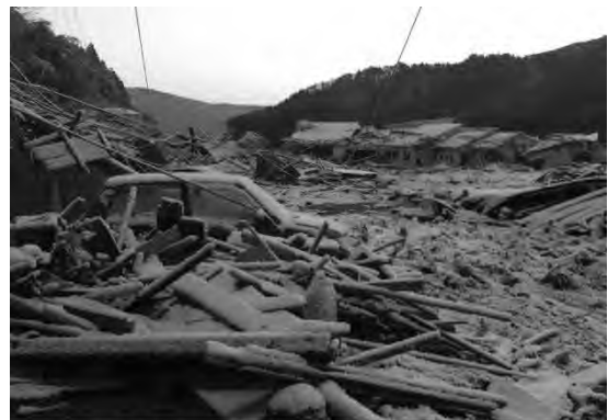
12日未明 ただ茫然 生きていてほしい

私たちは山に逃げたので、町を津波が飲み込んでいくその瞬間は見えていません。次の日、初めて山から下りて町の光景を見ます。これが、そのときの状況です。まず、言葉になりませんでした。後々、よくテレビ局のインタビューで「このとき、何を感じましたか」と質問されても、言葉が出てこない。ただ茫然と立ち尽くすしかなかった。ただ、願わくば子どもたちです。このリアス式海岸特有の急峻な山が迫っている中を、何とか自分たちのように共に逃げ切っていてほしい、77名いる生徒に、とにかく生き残っていてほしいという願っただけでした。