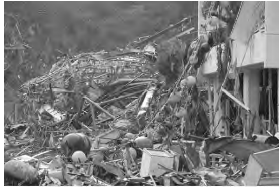
校舎の脇に体育館の残骸が・・・卒業式の紅白幕がみえる

体育館はどこに行ったのかと思ったら、やはり校舎の片隅のほうに残骸となってありました。つい先ほどまでお祝いの象徴だった紅白の幕が、無残にもこのように引っ掛かっています。校舎周辺はこのような状況です。