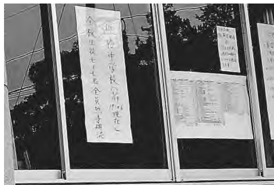
避難所から大きな拍手が

このときです。私は、「学校教育こそがあなたたちを守る」と。何の根拠もありません。ただ、やはりあの人達にとって、当時は「今日をどう生きる、明日をどうする」という状況下の中で、子どもたちが全員生きていたということは、本当に暗闇の中の光を見る思いだったと思います。「子どもは宝だ」とよく言いますが、あのときほど私は実感したことはありません。子どもたちは宝なのだ。やは