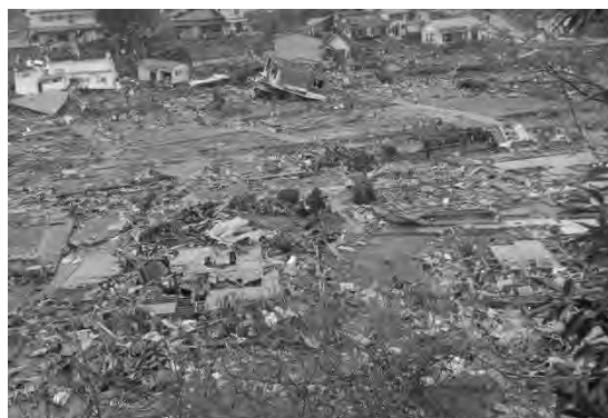
生徒の安否確認で涙をまわる

そして 3 日間を山で過ごしたのですが、もうそこには生徒たちが来ることはないだろう、安否確認も進まないということで、山を脱出します。そして雄勝の方々がヘリコプターで運んでこられる、飯野川地区の飯野川中学校のパソコンルーム、体育館の向かいの部屋を、校長先生にお願いして一室を借りて、仮の職員室を置きます。そこに私は 1 人で寝泊まりをしながら、まだ危険な峠を越えて雄勝に入っていきます。