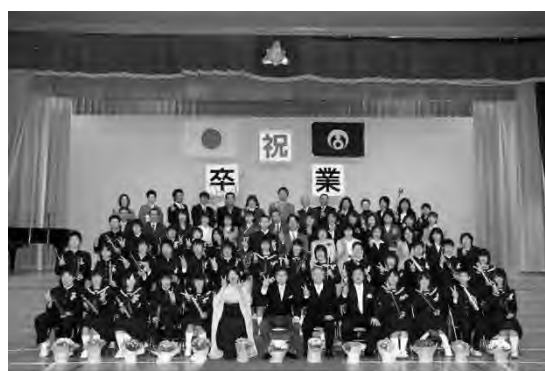
その日は卒業式だった

当日は卒業式でした。私が赴任して初めての卒業式ですので、心を込めて温かくみんなを送り出そうということで、随分時間もかかりました。私は式の中で、校長の最後のメッセージとして「たくましく生きていけ。自らの人生を自らの力で切り拓いていけ」という言葉を送りました。