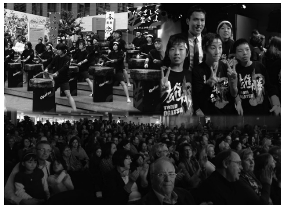
ベルリンでの演奏

そして、ドイツから帰ってきました。今度は、巨人対ヤクルトのプロ野球開幕戦のオープニングセレモニーで打ってほしいというオファーが来るわけです。私は5万人の観客の前で、そして全国へ感謝の気持ちを伝えることができたということなので、お受けします。これはちょうど3月30日なので、私はもう校長としては最後の夜を子どもたちと過ごしたわけです。実際は、この間に隠れて潜んでいます。