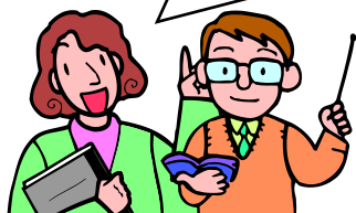
活用した学校からの声

教材・行事の準備などを手伝ってくれてとても助かり、子どもたちにも余裕をもって接することができました。