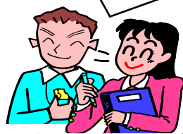
経験した学生の声

多くの先生方から様々なアドバイスを頂き、児童との関わり方だけでなく、席替えや係活動・クラス遊びといった学級経営の方法や先生としての心構えや楽しさなど多くの学びがありました。