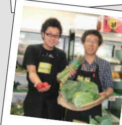
特産！嬬恋村の キャベツとアスパラ

【ふれあい神田市場】 〒101-0042 東京都千代田区東松山下町 49 Tel・Fax 03-3251-2031