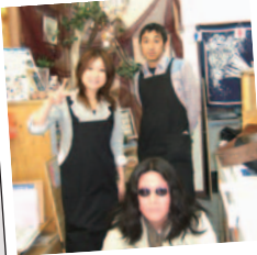
なごみま鮮果店内