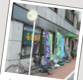
ふれあい神田市場

4月からふれあい神田市場店長として、嬬恋村から神田にやってきました。新メンバーでスタートして間もないですが、日々、水野ゼミ生の気力・やる気を感じうれしく思っています。今後は、学生のアイデア生かした嬬恋村の特産品の開発などを行ってもらいながら、店を盛り上げ、村・商店街の活性化にもつなげていきたいです。神田の店はもちろん、嬬恋村もいいところなのでどうぞ足を運んでみてくださいね。