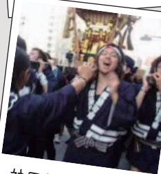
神田祭にて神輿を かつぐ若林ゼミ生

【なごみま鮮果】 〒101-0045 東京都千代田区鍛冶町 2-5-11 ミハラビル1F Tel・Fax 03-6303-0330