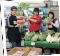
美味しい野菜 いかがですか？