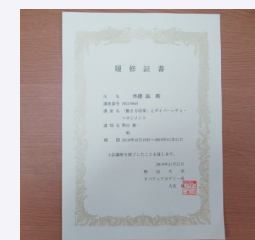
過去受講時に頂いた履修証書