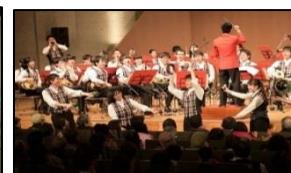
益城町・阿蘇市でのマンドリン 演奏会