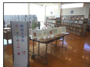
学生が作成した本の紹介カード