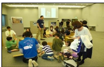
ホームカミングデー（段ボールトイレ作成・子どもとの防災ゲーム）

本学博物館で開催した福島震災遺産保全プロジェクトのアウトリーチ事業「震災遺構を考えるⅢ」の「震災遺構とふくしまの経験—暮らし・震災・暮らし—」を後援した。 (2017年1月-2月)