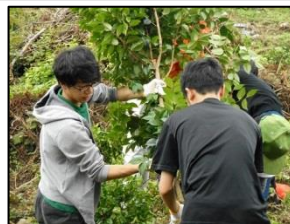
椿植樹支援(椿産業プロジェクト)