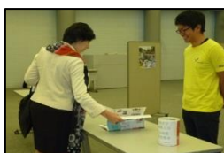
ホームカミングデーで の熊本地震写真展