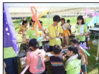
やるしかねえべ祭り 明大ブース