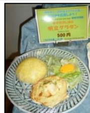
被災地の食材を使った学食メニューを提供