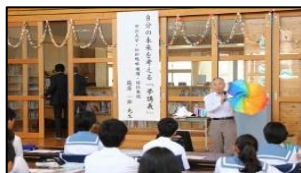
木山中学校での折紙工学 「夢講義」