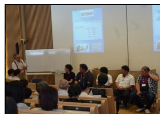
『新地町の漁師たち』上映会&対談