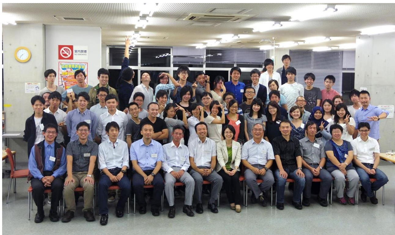
懇親会にて集合写真

参加者の研究分野はイオンチャネル機構から、細胞生理学、視覚生理学、ヒトの高次認知機能、心理学研究、臨床研究、バイオセンサ、ブレインマシンインターフェースなど、生命科学ならびに医用生体工学における細胞・分子レベルから個体レベルまでの幅広い領域をカバーしており、理工学と生命科学の異なる観点からの議論は学内だけでは得られない様々な情報交換の場となりました。今後の研究交流のさらなる発展が望めます。最後になりましたが、本シンポジウムへの手厚いサポートをいただきました国際連携本部ならびに国際連携事務室の皆様に厚くお礼申し上げます。