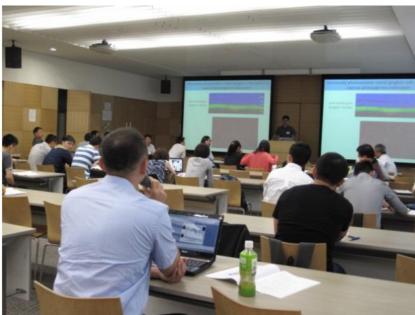
シンポジウムでの質疑応答

ポスターセッションは日台から 3 名ずつの優秀発表賞を設け、白熱した議論が行われました。2 時間半のディスカッションタイムが終了しても、まだ説明を続けているグループも多く、face to face のコミュニケーション・ディスカッションは学生たちにとって重要な経験となったようです。