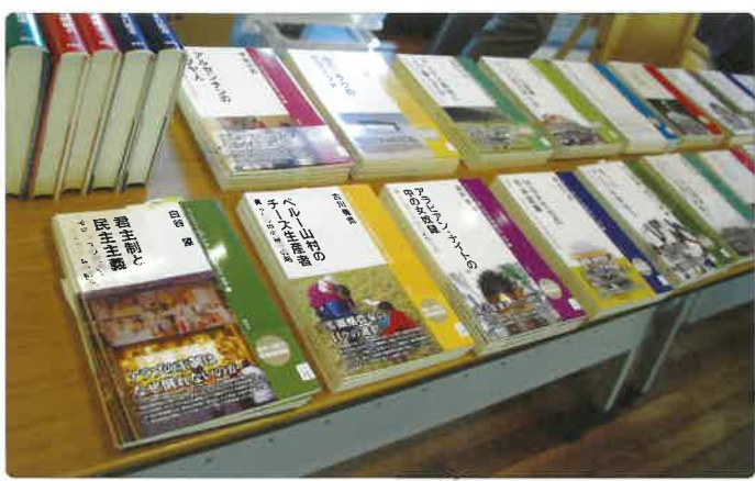
ブックレットとして出版