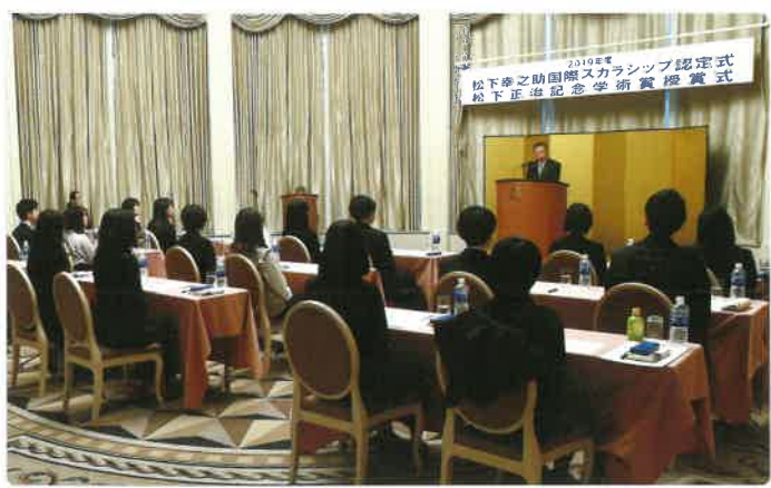
松下正治記念学術賞として出版