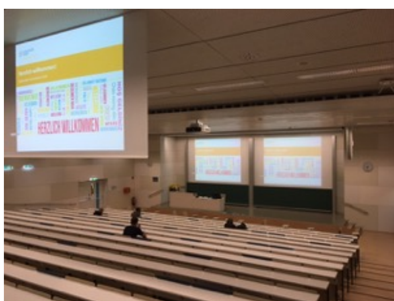
経営学部のカンパスの大教室