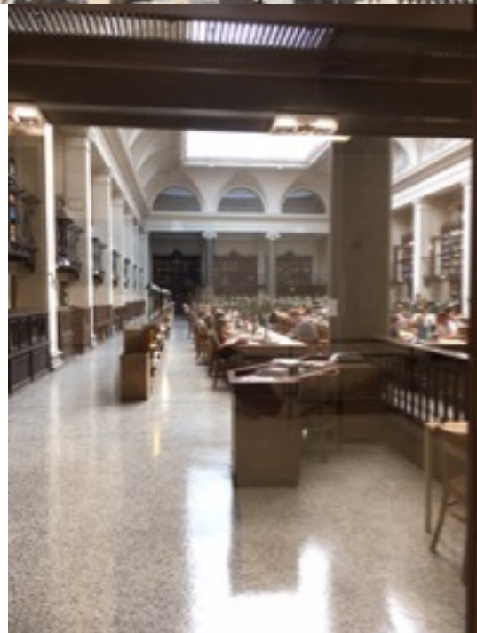
講堂にある回廊と中央図書館