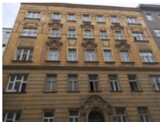
9月に住んでいた寮のシャワーと10月から住んでいる8区の家（戦前に作られた建物”Altbau”です）