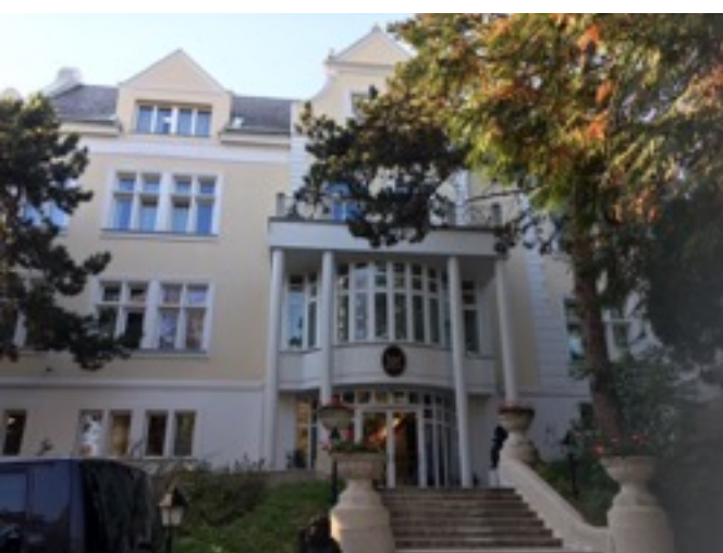
ガムラン音楽の授業を行っているインドネシア大使館