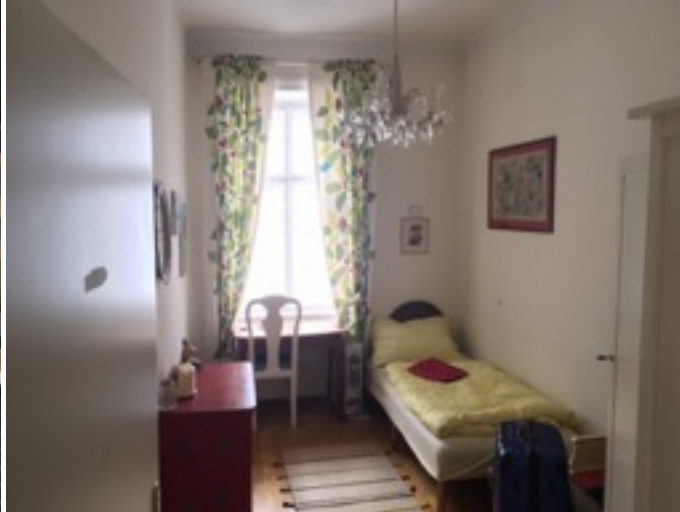
10月から住んでいる家のキッチンと自室（家賃は380ユーロ）