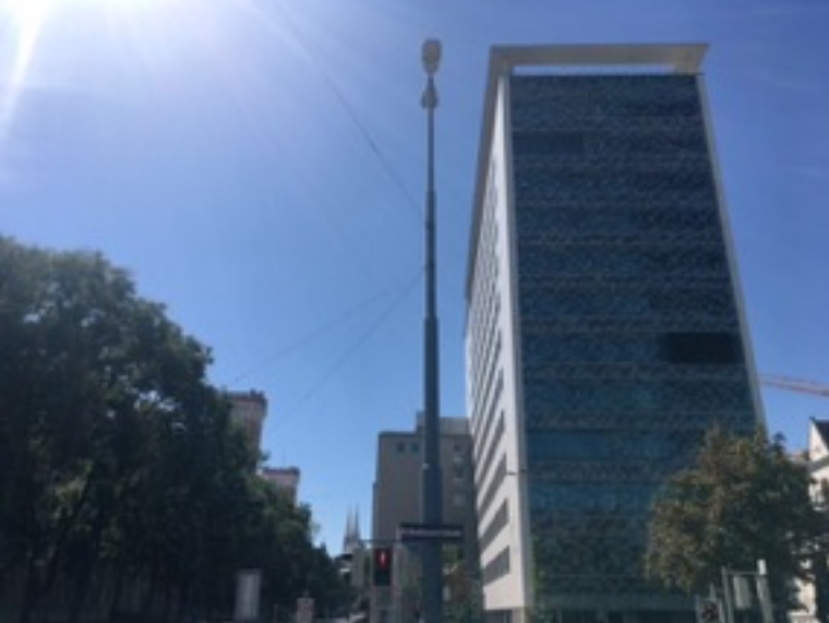
キャンパス（経営学部）と主に式典を行う講堂