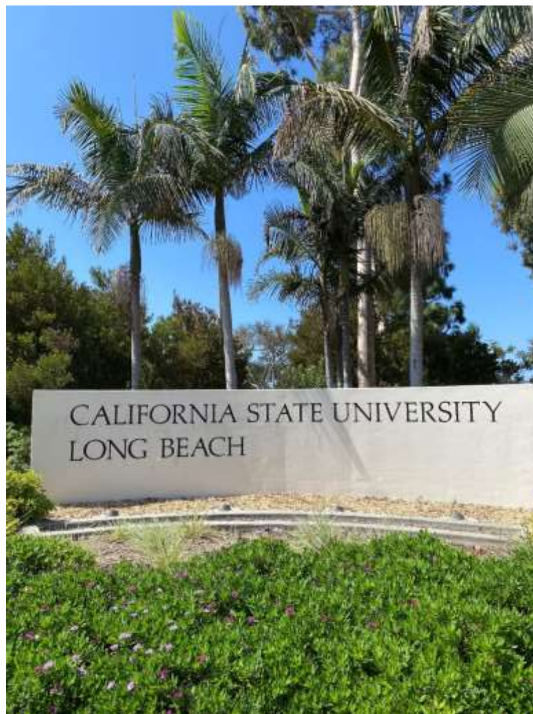
キャンパスの入り口

出発前に授業を登録した方は、現地で変更・追加できましたか？また希望通りの授業が取れましたか？