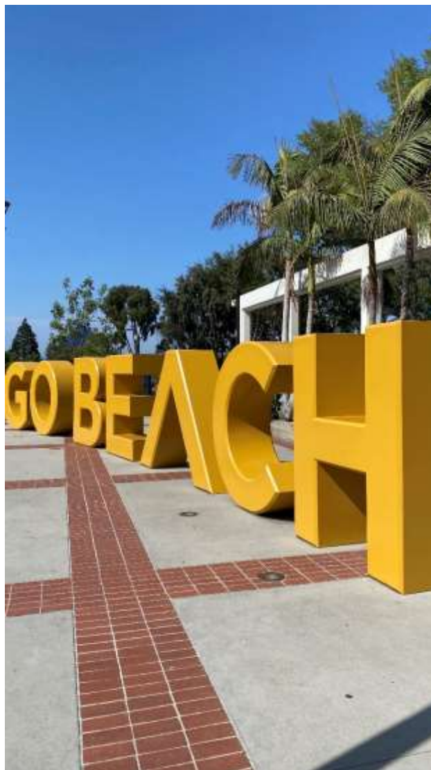
学校の名前が書かれたモニュメント

留学に少しでも興味を持っている人は、ためらわず、頑張って一歩勇気を踏み出してみたいと思います。