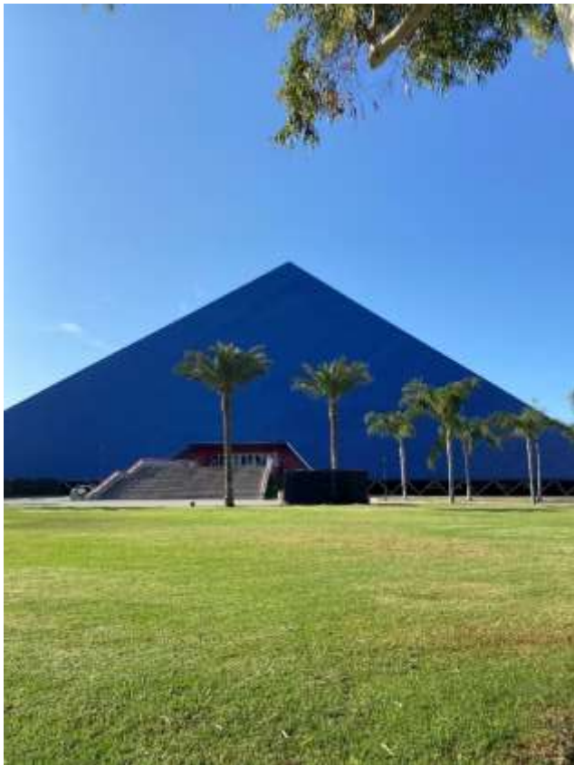
大学のスポーツ施設 地域の有名な建築物にもなっている