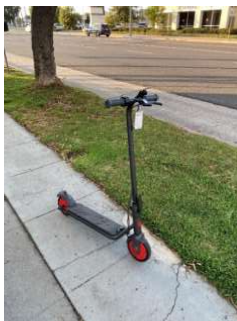
通学に使用している電動キックスクーター