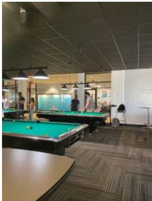
キャンパス内のビリヤード場