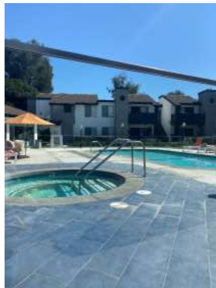
アパートのプールとジャグジー