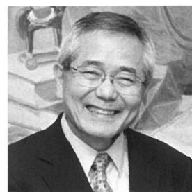
米パデュー大学 根岸 英一特別教授 (帝人グループ名誉フェロー) 帝人久村奨学生第5回生(1957年)

そして自らの「夢」を見つけたら真理を突き詰めるまで、とことんチャレンジしてください。今後の皆さんの大いなる活躍に期待しています。