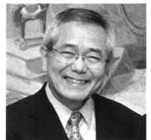
故 根岸 英一 氏 帝人久村奨学生第5回生(1957年)

そして自らの「夢」を見つけたら真理を突き詰めるまで、とことんチャレンジしてください。今後の皆さんの大いなる活躍に期待しています。