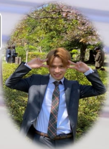
こばけん 経営学部2年