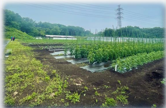
黒川農場実習圃場