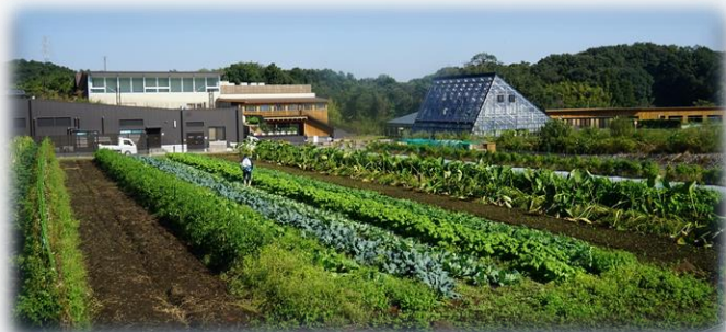
キャンパス内圃場