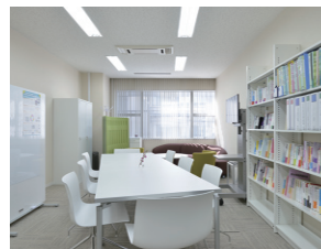
生田分室 （生田キャンパス）