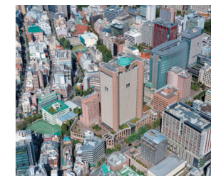
東京のど真ん中に自分専用の固定席を持つ贅沢な学習環境です。