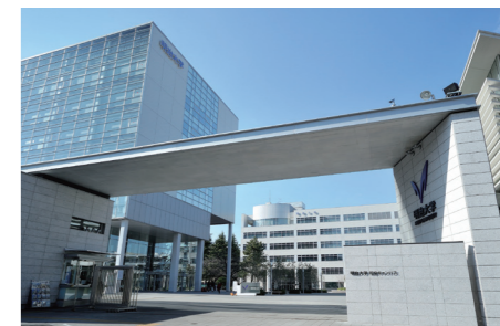
和泉キャンパス内リエゾン棟に自習室があります。時間を有効に活用できます。