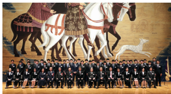
※2022年度の公認会計士試験現役合格報奨金授与式

2 公認会計士試験合格に重要な計算科目に特化した講座を独自に開講しています。大学の授業との両立や価格面で学生の便宜を図っています。計算力をつけた状態で提携専門学校の本科クラスへと橋渡しをしている点特徴です。