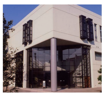
自習室 (和泉) キャンパス内リエゾン棟に設置されています

※経済系科目:経済学・財政学・経済事情など 法律系科目:憲法・民法・行政法など 行政系科目:政治学・行政学・社会学・国際関係など 共通科目:国家総合職、一般職、地方上級共通科目