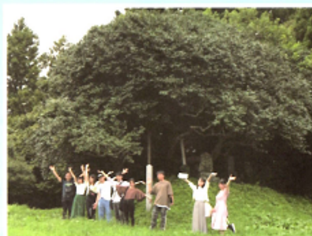
この教材を作った平山ゼミの人たち

原案：明治大学文学部・平山満紀ゼミ学生一同（2019年度） 協力：サッポロホールディングス株式会社 制作：大船渡市 発行：2020年3月