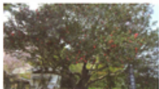
さんめんつばき 三面栴 (末崎町)

熊野神社境内にある樹齢1400年、日本最大・最古と言われているつばきです。岩手県の天然記念物に指定されています。