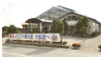
せかいのつばきかんごいし 世界の栴館・墓石 (末崎町)

世界の栴館・墓石には、世界13か国約550種類のつばきがあります。1月から3月には「つばきまつり」が行われています。