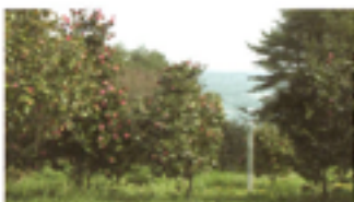
ごいしつばき 墓石栴園 (末崎町)

墓石栴園には、約1000本ものつばきがあります。海とつばきがとてもきれいに見えます。