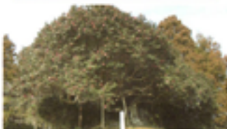
みづつばき 株栴 (三陸町越喜来)

三陸町越喜来字小泊にある樹齢約250年のつばきです。大船渡市の天然記念物に指定されています。この場所には昔、「平田城」というお城がありました。