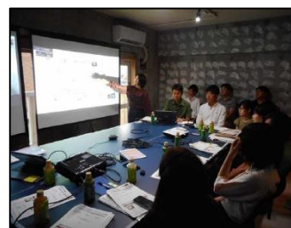
エクスターンシップ報告会の様子