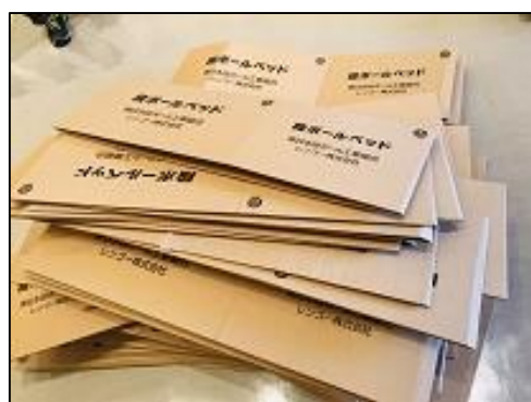
避難所移転の際に片付けた段ボールベッド (安平町公民館にて)