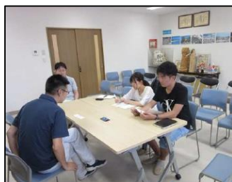
学生によるインタビュー調査