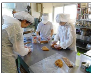
現地での職場体験

本活動は、富士通株式会社の協力も得ながら、産学官の連携による産業活性化の取り組みとして2017年度から継続して実施している。