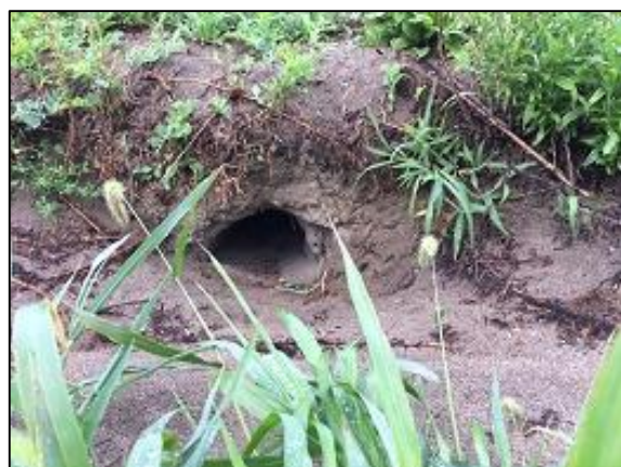
クロマツの植栽地で見られたキツネの巣穴