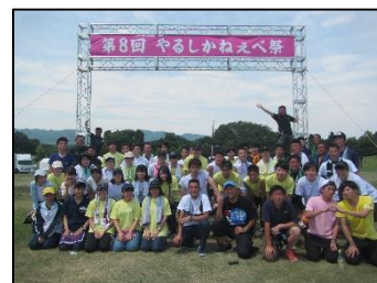
「やるしかねえべ祭り」実行委員会との記念撮影

● 物産販売の補助：新地町が出展する首都圏での物産販売に協力。特産品の販売補助を通じて、新地町の魅力を来場者に伝えた。