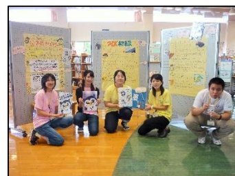
新地町図書館で活動した司書課程履修生