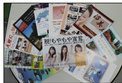
AWCや気仙沼を題材に、受講生が製作したフライヤー