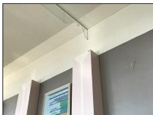
地震で破損した施設(安平町公民館にて)