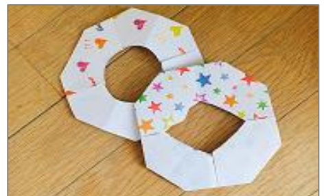
被災地の子どもたちと作った「輪」 (福島県南相馬市)/LINKs