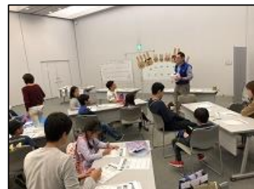
親子で防災について考える