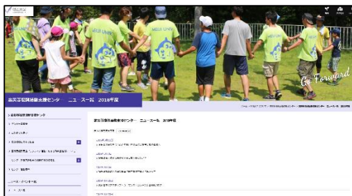
センターのホームページ

ホームページでは、センターの取り組みやイベント等の情報発信をはじめ、ボランティア助成金を利用した学生・ボランティアサークルの活動内容や成果を紹介。特にボランティア活動を続ける学生には「一人でも多くの学生にボランティア活動に関わってほしい」という思いがあるため、ホームページを通じた積極的な情報発信を行っている。また、これまでセンターのボランティア事業に参加し被災地を訪問した学生に対しては、当該地域に関する情報を適宜提供している。