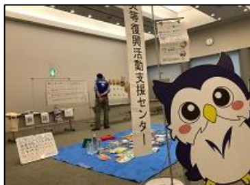
会場ではめいじろうがお迎え