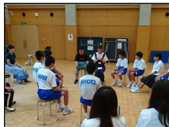
「しんちーむ」による「特別授業」。中学校では大学の学部を紹介。