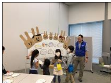
防災グッズをえらぶ子どもたち