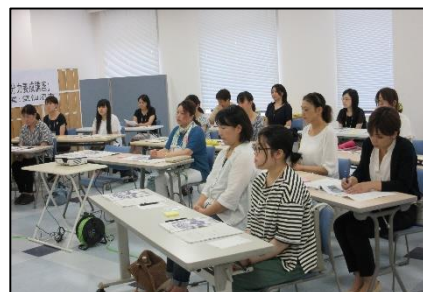
講義初回。少し緊張した様子の受講生。