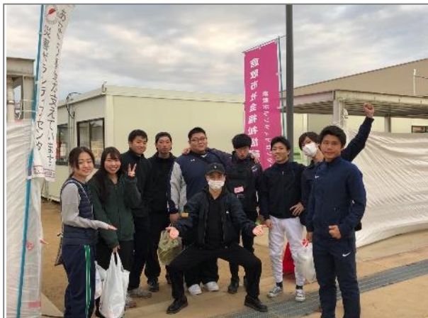
西日本豪雨の復興支援(岡山県倉敷市)／商学部柿崎ゼミナール