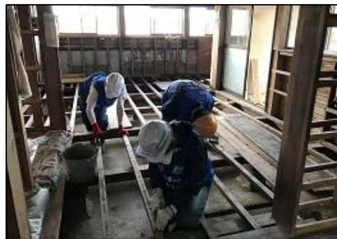
根太と床材を密着させるためのボンドを取る家屋清掃活動の様子(作業)