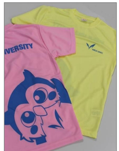
明治大学オリジナル 復興支援Tシャツ