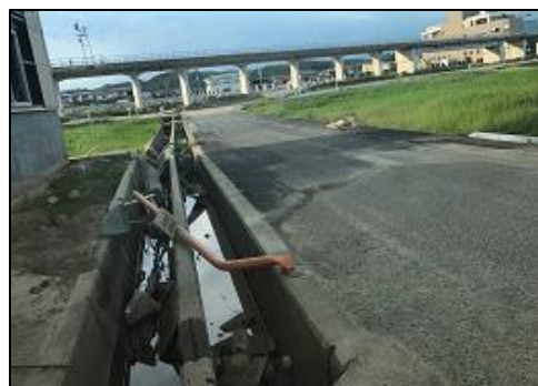
豪雨災害によって折れたカーブミラー