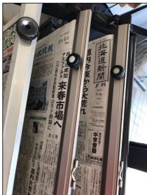
震災の直前の日付のままの新聞 (安平町公民館にて)