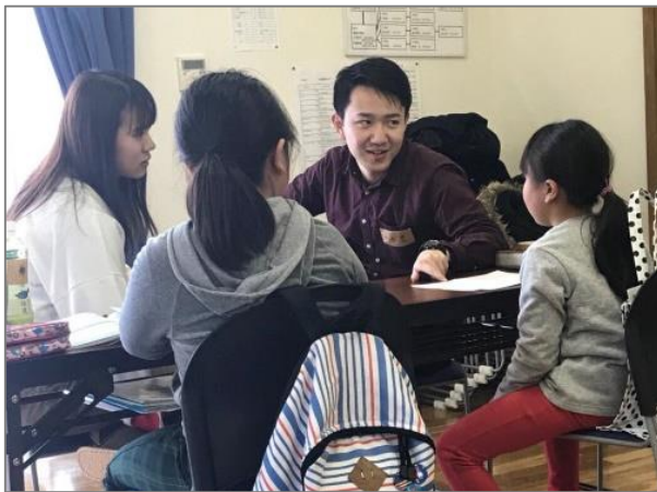
子どもたちの学習支援(宮城県南三陸町)／きずなInternational