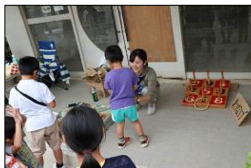
イベントをお手伝いした際の様子