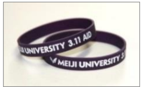
明治大学オリジナルのリストバンド