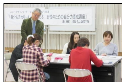
回を重ねるごとに和やかな雰囲気に。グループワークで笑顔もみられるように。