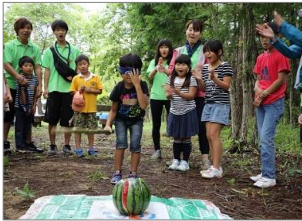
デイキャンプ開催(新地町)／体育会ローバースカウト部