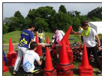
祭りの翌日、後片付けに汗を流す学生たち