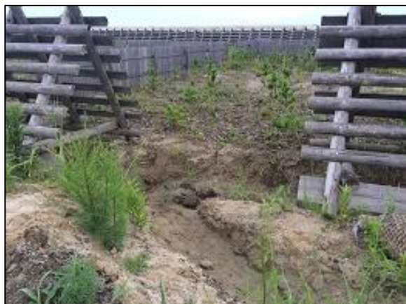
水はけをよくするための溝 (溝切り後の様子)