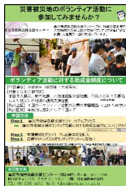
←ボランティア助成金制度のフライヤー